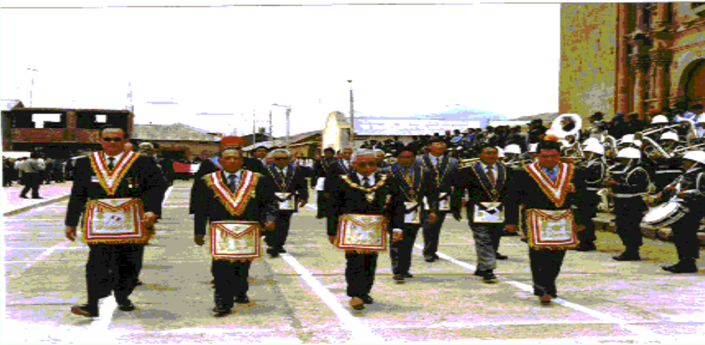
Los Masones Peruanos encabezando el desfile civico militar