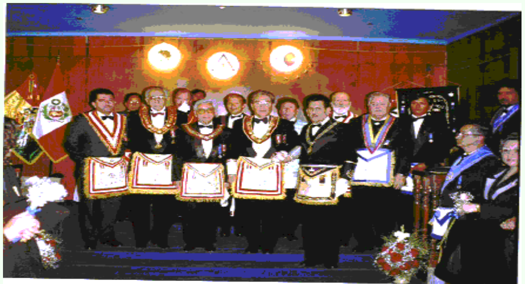
Parte de los asistentes al Congreso en la Logia Cuna de los Incas N° 39 en Puno.