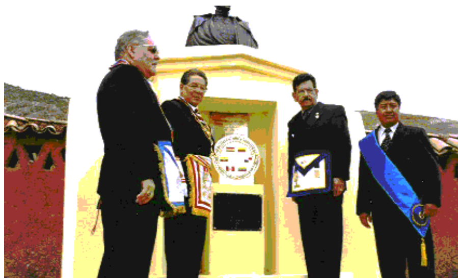
La develación de una Placa conmemorativa en el Pueblo de Pukara en la Ceremonia Cívico Masónico por el Gran Maestro del Perú y el Gran Maestro de Venezuela y el Alcalde de Pukara.