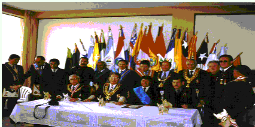
Parte de la mesa de Honor en la Municipalidad de Pukara.